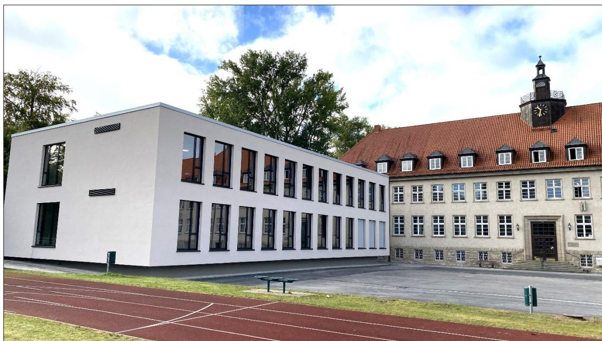
Ansicht des Gymnasiums von 1929, das 2020 durch einen Anbau erweitert wurde.

1952 begann im Gebäude wieder der Unterricht, den nun Mädchen und Jungen gemeinsam besuchten. Während der sozialistischen Diktatur verlor die Schule allmählich ihren humanistisch-christlichen Charakter komplett, auch wenn die Schüler zu einem sehr hohen Prozentsatz Christen waren. Von 1959 bis 1990 hieß das frühere Gymnasium „Erweiterte allgemeinbildende polytechnische Oberschule“ (EOS) und bekam 1973 den Namen des deutschen Kommunisten und ersten Präsidenten der DDR, Wilhelm Pieck, verliehen. Als vier-, später zweijährige Oberschule angelegt, war sie, wie alle Schulen in der DDR, vom Erziehungsmonopol des Staates und dessen politisch-ideologischer Zielsetzung geprägt.