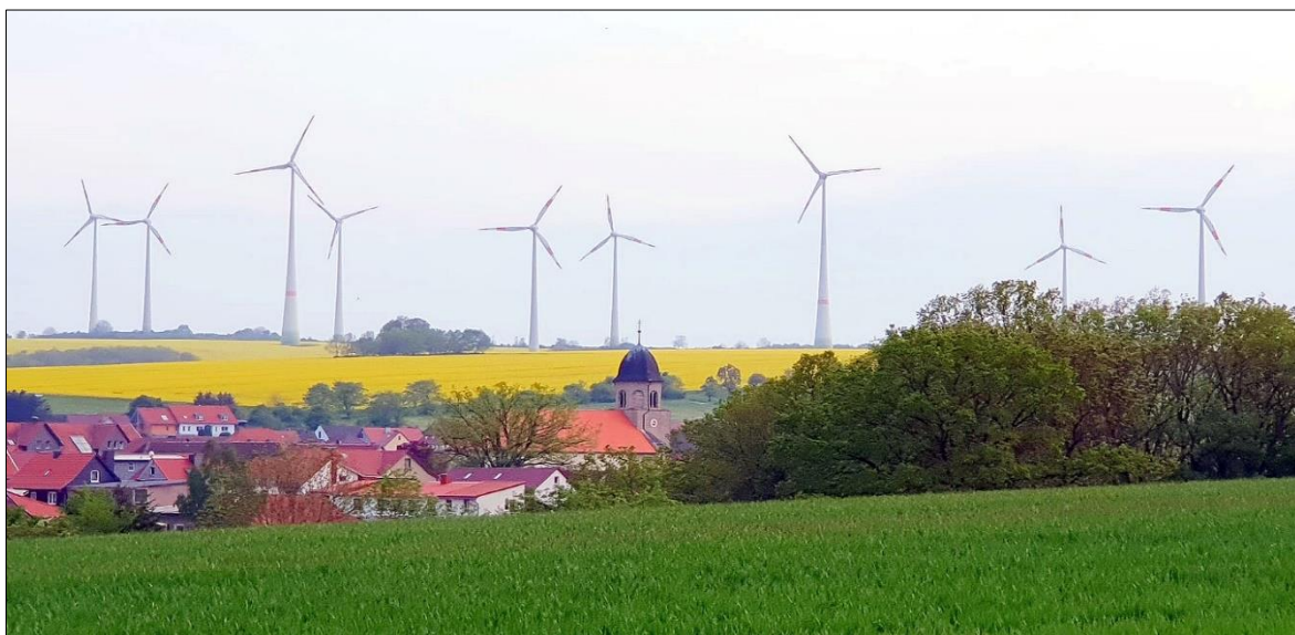
Typisch für Büttstedt sind die Haube des Kirchturms und die Windräder im Hintergrund.