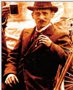
Josef Dirk (1868–1950) im Jahr 1901.